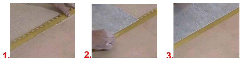
Ejemplo de colocación del Novonivel ®

Para su instalación disponer el pavimento sobre el ala de fijación del perfil procurando que el material de agarre fluya a través del troquelado para su óptima fijación. Se recomienda no quitar el film protector hasta que haya finalizado la instalación para evitar posibles daños o pérdidas de aspecto.