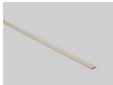
Champagne - 166