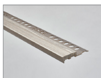
Gris vintage - 159