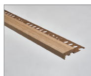
Marrón vintage - 160