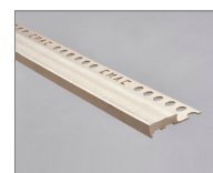
Blanco vintage - 161