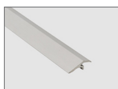
Plata mate - 13