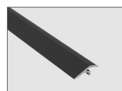
Negro mate - 90