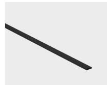
Negro mate - 90