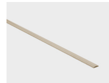
Champagne - 166