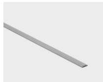
Plata mate - 13